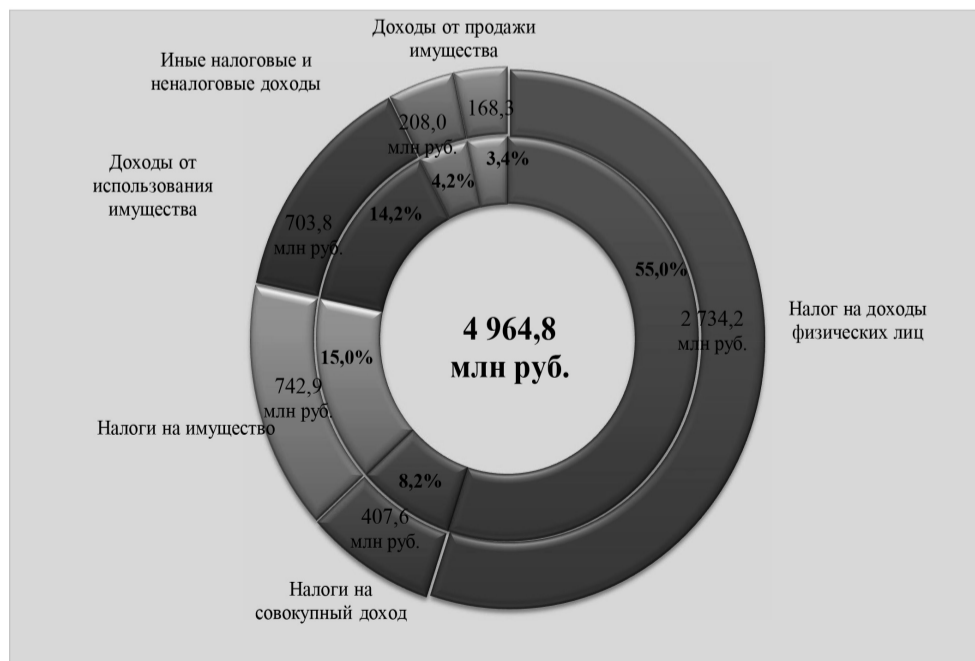
Структура налоговых и неналоговых доходов бюджета города Твери на 2024 год

В трехлетней перспективе будет продолжена работа по укреплению доходной базы бюджета муниципального образования города Твери за счет сохранения имеющихся доходных источников и мобилизации в бюджет потенциальных резервов.